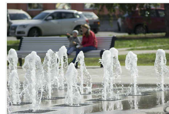
"Сухой" фонтан в зоне отдыха.