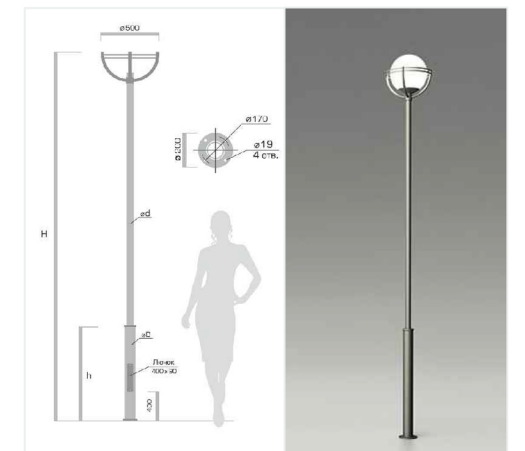
Площадка для отдыха молодёжи с тренажёрами и местами для отдыха и общения . Светильники парковые.